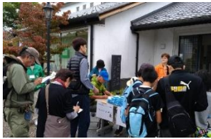
10月7日 陶の里フェスティバル市之倉会場にて

10月中旬から11月中旬にかけて、多治見市に訪れる観光客の年齢層や満足度、観光施設の現状を把握するため、市内の複数の観光施設に於いて、観光客に対するアンケート調査を行っています。その集計結果を基に各観光関係者と連携をとりながら、多治見市への観光誘客や施策を練っていく予定です。