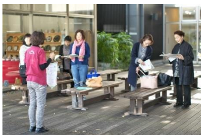
NO. 14 本町オリベストリートの魅力発見