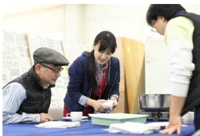
NO. 13 転写シールを貼るオリジナル食器