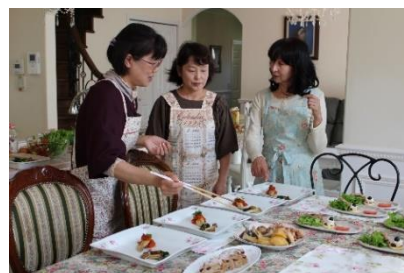
NO. 06 薔薇づくしの絵付け体験と料理教室